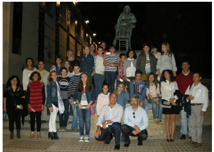
El grupo ante la estatua de Mozart, a la entrada del Teatro de la Maestranza